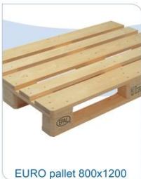
EURO pallet 800x1200

Een Europallet is een houten pallet met afmetingen en specificaties die door de European Pallet Association (EPAL) vastgelegd zijn. De afmetingen zijn 800x1200x144 millimeter. Onze pallets worden gestapeld in eenheden van 1.000kg.