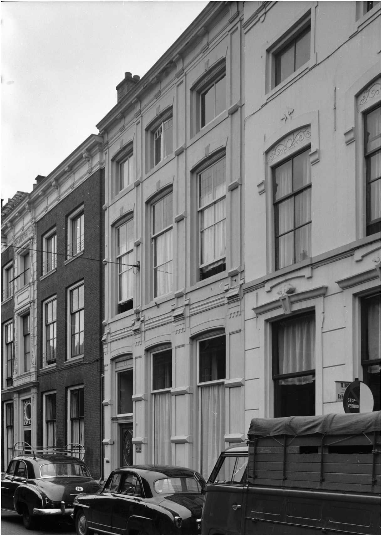
Koestraat 14