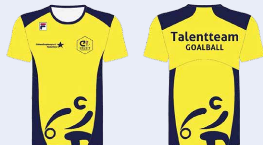
Manneselectie voor EK-C, onderdeel van de European Para Championships

uitgevoerd. In totaal zijn er 12 clinics gegeven, hebben er structureel (open) trainingen plaatsgevonden en zijn Multisportdagen georganiseerd waar goalball een prominente plek heeft gekregen op het sportprogramma. Er is een community bijeenkomst georganiseerd voor scheidsrechters. Voor de ontwikkeling van de sport en het kunnen vinden van potentieel talent is dit een belangrijke stap. In Apeldoorn is eind 2023 een Multi talentcentrum geopend waar periodiek goalball trainingen worden gegeven om potentieel talent te ontdekken en een betere verbinding naar het JCF Talentteam en het Nederlands team mogelijk te maken. Verder heeft goalball tijdens het EPC een groot publiek bereikt via de sociale mediakanalen van het internationale multi sportevenement.