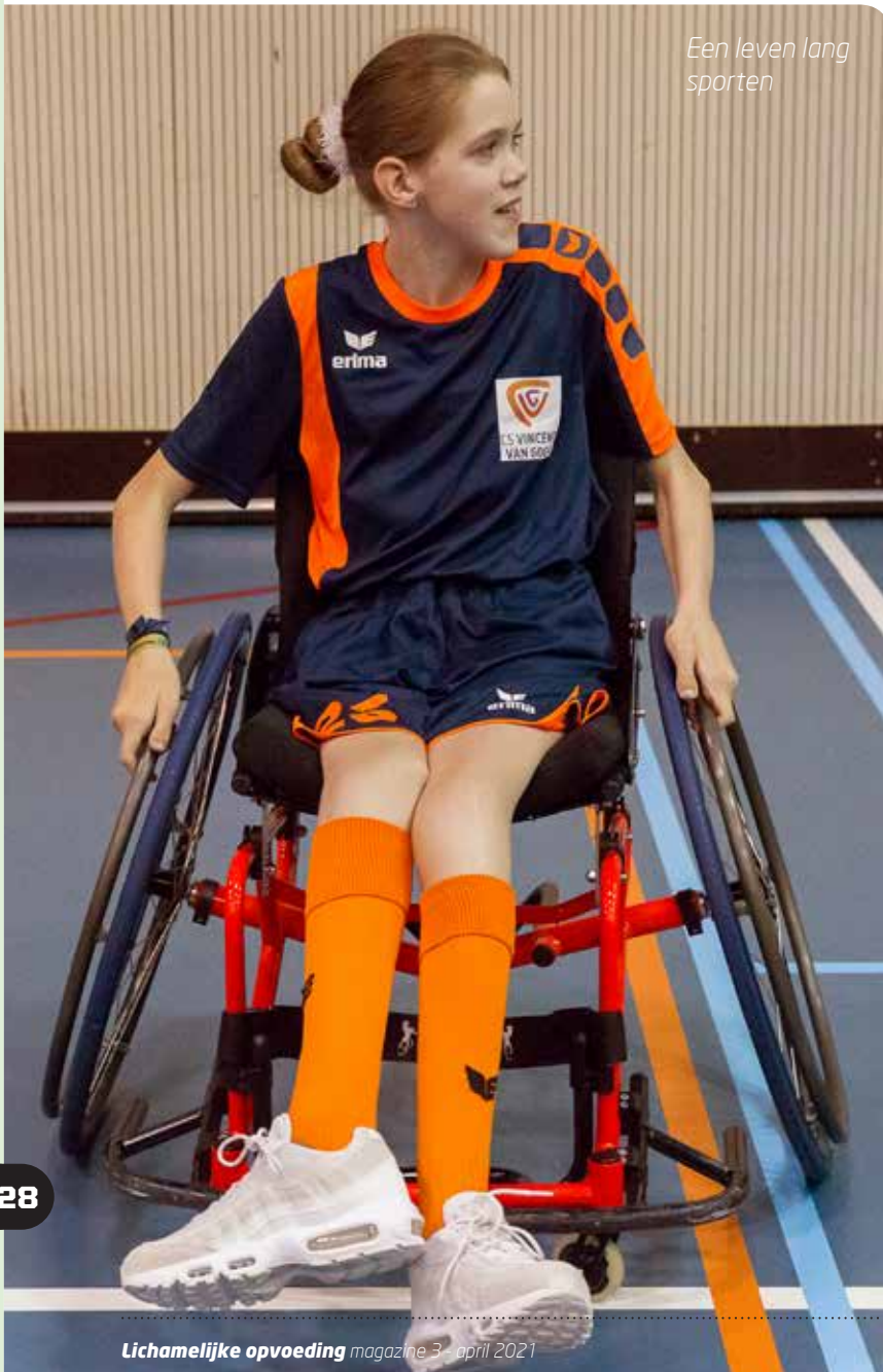
Een leven lang sporten