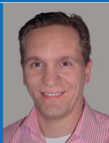
Opgesteld door Gerben Polman, FAD, administratie- en belastingadvieskantoor Doetinchem en Dinxperlo, www.fad.info

Min./max. gecombineerd verbruik: 7,5-13,8 l/100 km, resp. 13,3-7,2 km/l, CO 2 -uitstoot resp. 196-322 g/km. 3 jaar fabrieksgarantie tot 100.000 km. Consumentenprijs vanaf € 114.400 incl. BTW en BPM. Leaseprijs vanaf € 2.177 p.m. excl. BTW (bron: Land Rover Financial Services, full operational lease, 48 mnd., 20.000 km/jr.). Prijs- en specificatiewijzigingen voorbehouden.