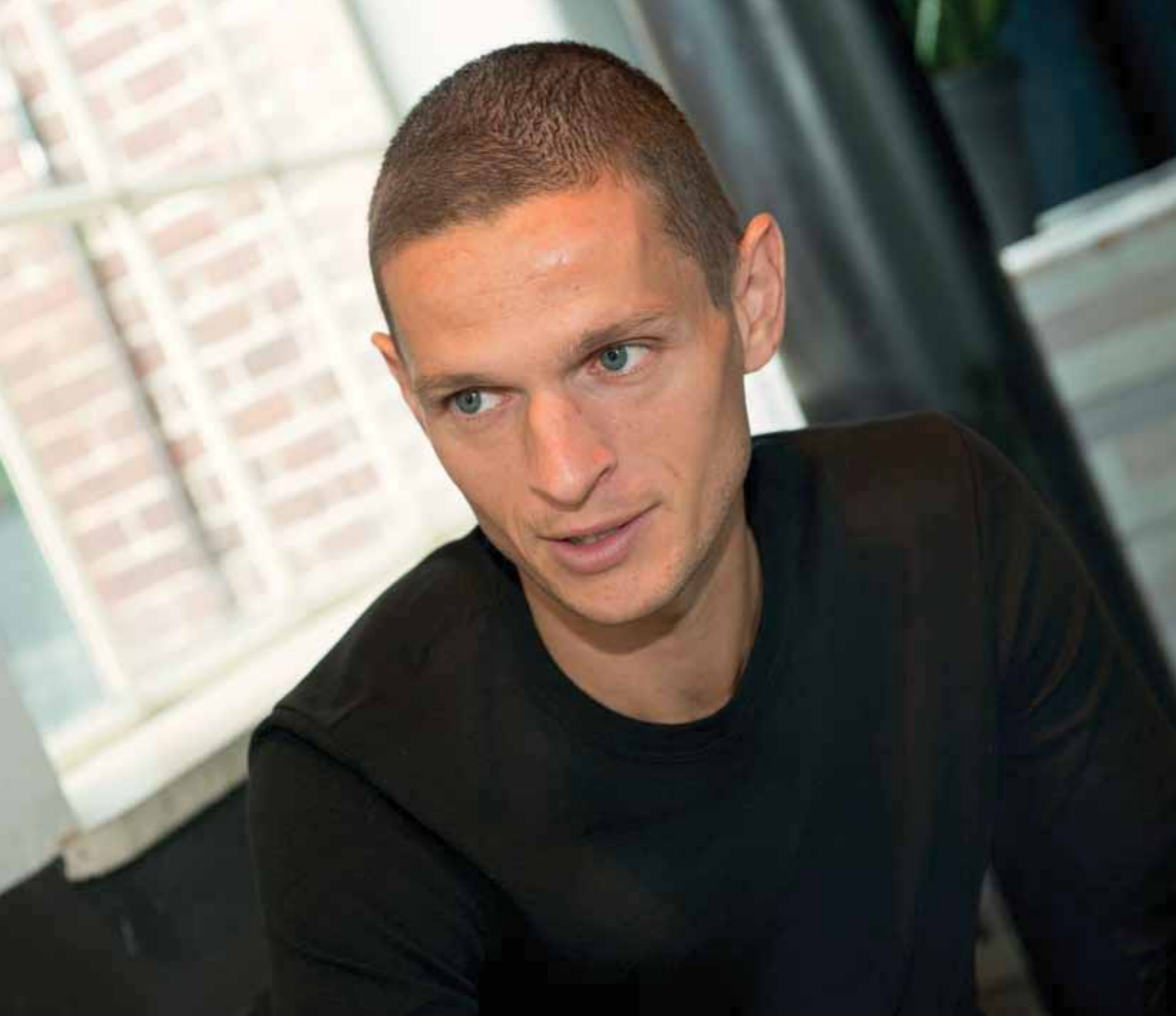
"Ik ben absoluut nog van waarde."