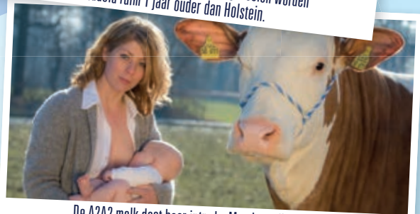
De A2A2 melk doet haar intrede. Moedermelk is A2-melk evenals de meeste Fleckviehmelk. Boeren hebben een voorkeur voor 100% hoornloze stieren en A2A2 melk.