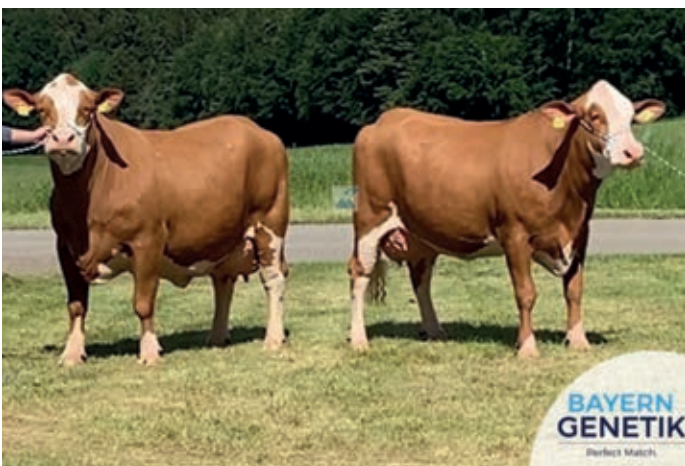
Grootmoeder en moeder van Medeon PS