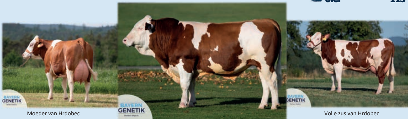
Moeder van Hrdobec