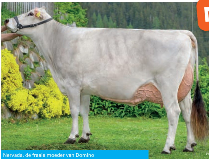
Nervada, de fraaie moeder van Domino

* Acties gelden niet voor beperkt beschikbaar sperma en gesekst sperma.