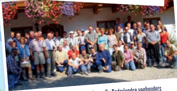
De eerste Fleckviehreis naar Beieren. De Nederlandse veehouders ontdekken dat bespiering en een flinke pas melk goed samengaan.