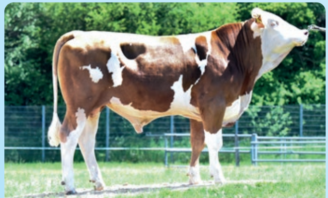
BFG Hanoman, fokt brede koeien en is een echt fitness kanon.

NIEUW BFG Hanoman fokt groot, breed in het kruis en mede daardoor kleine ondiepe uiers (121). De moeder is een echte Etoscha, dus een fors bespiede koe met veel melk en fraaie beaderd uier. Hanoman is een echte fitness topper met super dochter vruchtbaarheid (126), uiergezondheid (123) en persistentie (110). Daar bovenop beloofd Hanoman een mooie productie.