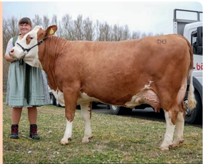
Hokuspokus dochter Bambi, 6 e kalfs. Prod.: 10.552 kg melk, tkt.: 363 dagen.

Dus: +831 kg (oude fokwaarde Hokuspokus) minus +646 kg (genetische vooruitgang Fleckviehras) = +185 kg melk . Dat is zijn nieuwe fokwaarde door de basis aanpassingen in april 2026.