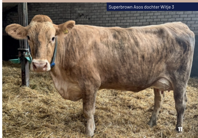
Superbrown Asos dochter Witje 3

Tijdens een recent bezoek legde Arend Zendman een aantal dieren vast. Eén van de uitschieters is Superbrown Asos dochter Witje 3, met een verwachte productie van maar liefst 10.746 kg melk in haar eerste lactatie. Kortom, resultaten waar ze bij de familie Hendriks - Wijgerde Farm met recht tevreden over mogen zijn en een mooie bevestiging van wat Superbrown Asos in de praktijk kan brengen.