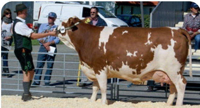
Demonstratie hoornloze Fleckvieh koeien op open dag LFL proefbedrijf Grub. Hier de 3 e kalfs BFG Mandela dochter Bibi Pp, moeder van de stier Irola PS. Productie Bibi Pp.: 11.335 kg melk, 4,37% vet, 3,56% eiwit. (2012).

tot 75 procent van de inseminaties met sperma van genomische hoornloze stieren uitgevoerd. Sterker nog: in de top-14 meest verkochte Fleckvieh stieren in Duitsland van 2014 stonden maar liefst 7 hoornloze stieren en 1 gehoornde stier van Bayern Genetik. Waar vroeger enkele populaire stieren de markt domineerden kiest Bayern Genetik bewust voor genetische spreiding. Dit om inteelt bij hoornloos te voorkomen. De aankoop van de 50% hoornloze stier Innovativ Pp voor 147.000 euro uit een aparte bloedlijn vormt hiervan het bewijs.