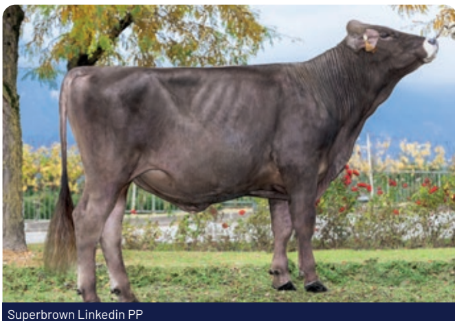
Superbrown LinkedIn PP

Met ruim 1200 kg melk laat hij zien dat productie dik in orde is. Daarbij klopt het plaatje ook qua bouw: sterke benen, beste uiers en een brede, krachtige voorhand. Precies waar je als veehouder naar kijkt. Zijn Triple A-code 465 bevestigt dat hij die kracht en breedte ook netjes doorgeeft aan zijn dochters. Kortom, een stier waar je wat aan hebt in de praktijk. Met Superbrown LinkedIn PP zet Superbrown een mooie stap richting een toekomstbestendige en makkelijk werkbare veestapel.