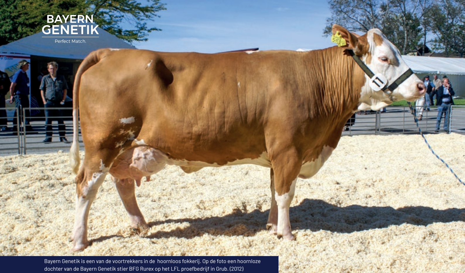
Bayern Genetik is een van de voortrekkers in de hoornloos fokkerij. Op de foto een hoornloze dochter van de Bayern Genetik stier BFG Rurex op het LFL proefbedrijf in Grub. (2012)