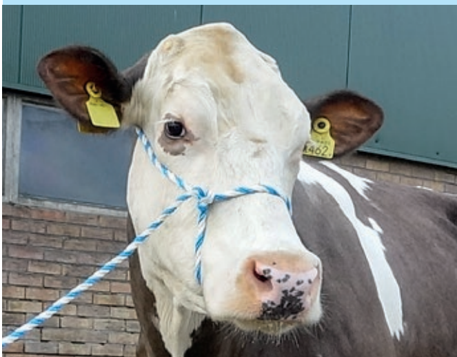
De stier BFG Ralmes PS is de vader van Wassenaar 356. PS betekent dat 50% van de kalveren "van nature hoornloos is met stoppjes". Wassenaar 356 heeft twee "stoppjes" die niet vergroeid zijn met de schedel maar vastzitten aan de huid.