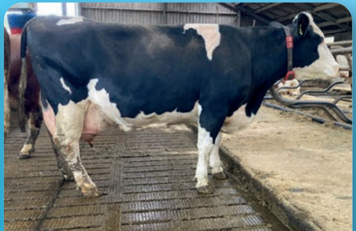
12 e kalfs BFG Engadin dochter met ruim 100-ton melk met gemiddeld 8243 kg melk 4.58% vet en 3.71% eiwit. LW: 103 en celgetal 9.