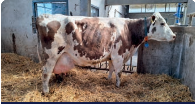
Caroliëna 114 heeft Fleckvieh power. Laat zien dat topprestaties geen leeftijd kennen!

Wat een prestatie van Caroliëna 114 van Mts. Hofman uit Noordhorn! Deze BFG Don Juan-dochter heeft onlangs de grens van 10.000 kg vet en eiwit doorbroken.