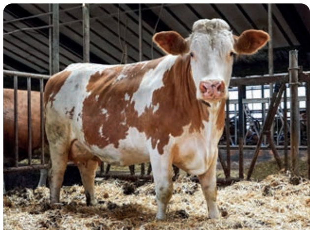
Cor 164, 100% Fleckvieh, v. Hokuspokus. Het resultaat van verbeteringskruising van Fleckvieh x Holstein. Een robuuste vaars met een voorspelde 1 e lact. van 10.408 kg melk en een celgetal van slechts 10.

"Zeer persistent dus," knikt Tonny tevreden. Haar voorspelde 305-dagenproductie is 10.408 kilo melk. Haar celgetal is 10. Haar LW is 126. "Kijk nou eens goed naar haar," zegt Tonny, terwijl Cor 164 langs loopt. "Ze is uitgegroeid tot een robuuste koe. Weegt ruim 815 kilo - de melkrobot houdt dat keurig bij -, produceert met het grootste gemak 10.000 liter melk en groeit daarnaast in conditie. Dát noem ik voerefficiëntie. Dit is een koe die tegen een stootje kan. Let op: als ze straks aan haar tweede lijst begint, doet ze er nog een schep bovenop!"