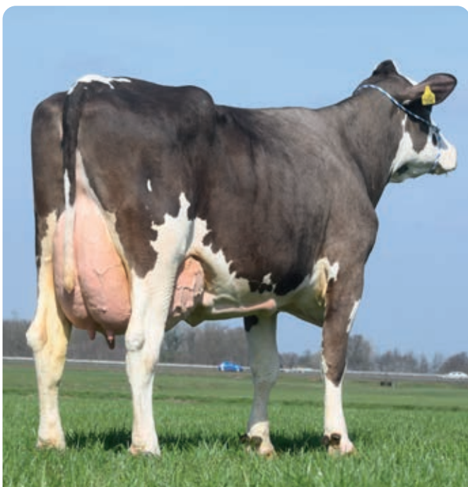
BFG Welfenprinz dochter Tine 7896 is bezig met een 4 e lijst van 11.128 kg melk met 6.38% vet en 3.88% eiwit. LW 127 en celgetal 7.

"Het Fleckvieh is in de loop der jaren melkrijker geworden en de uiers zijn veel beter geworden. We hebben nu een aantal Hokuspokus dochters aan de melk en die hebben super uiers. Ze kunnen echt oud worden, dat zie je nu al".