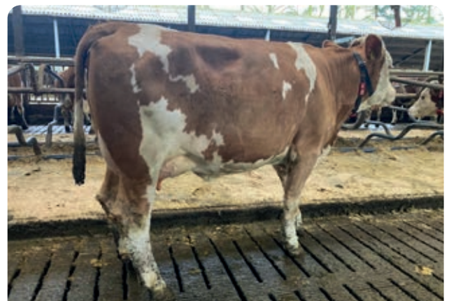
(Koenr 48) Een Hokuspokus dochter met 35 liter daags. "Veel lengte en iets groter, zo zie ik ze graag".

Bovendien is de productie ook nog eens 1000 liter per koe omhoog gegaan sinds we met melkrobots melken". De familie Hesselink is 20 jaar geleden met Fleckvieh begonnen, melkt inmiddels 95 Fleckviehkoeien en heeft naast grasland en maisland veel natuurland in gebruik. Ook wordt er regelmatig fokvee verkocht.