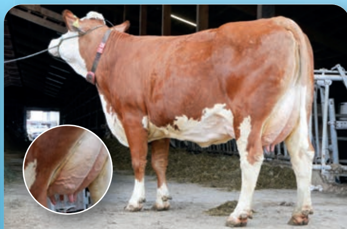
Tweedekalves Hochadel dochter Lexi produceert nog steeds 43 liter daags.