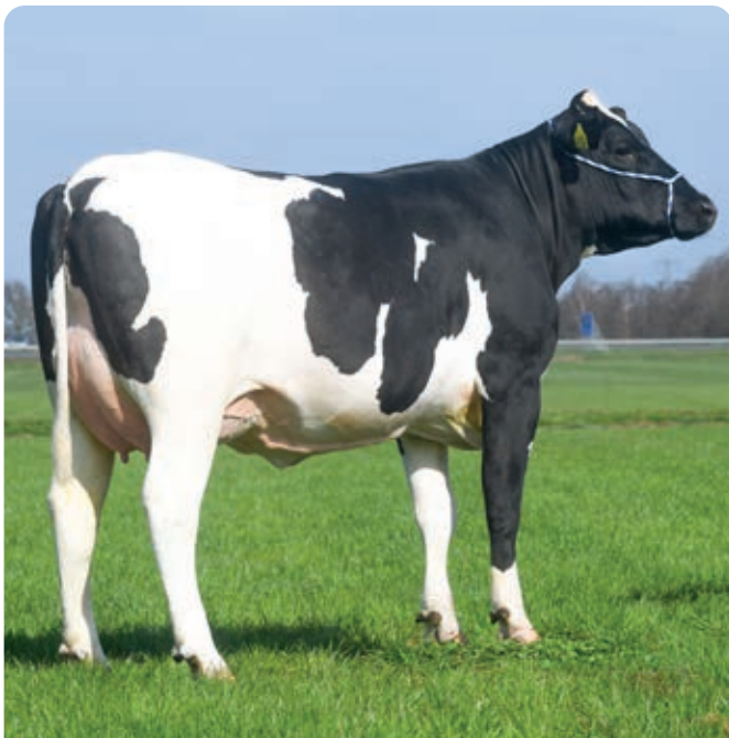
Hokuspokusdochter maakt een mooie productiestart met 3 melkcontroles van resp. 29/31/32 kg melk en wordt voorspeld op 8600 kg melk met 4.77% vet en 3.78% eiwit resulterend in 109 LW. "De Hokuspokus dochters hebben super uiers. Het zijn koeien die oud kunnen worden, dat zie je nu al", vertelt Leon van Wijk.