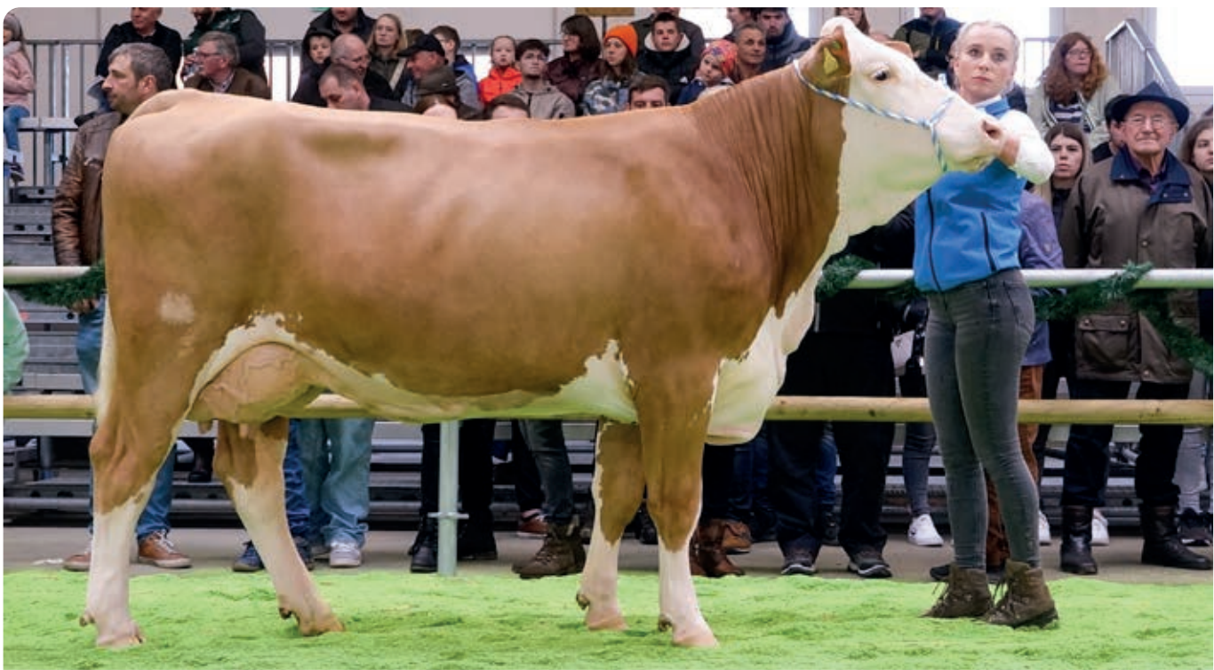
BFG Majestix PS liet een zeer fraaie dochtergroep zien waaronder deze luxe vaars met beste benen en een top uier met 31 kg melk daags.

Bayern Genetik Team Holland wenst jullie een vruchtbaar voorjaar!