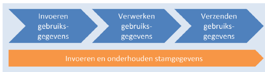
Figuur A Processtappen antibioticumregistratie door dierenarts

Deze processtappen zijn hieronder schematisch weergegeven: