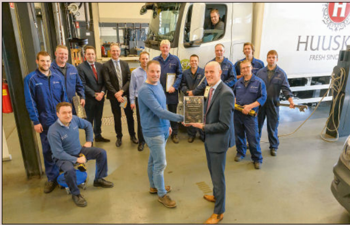
Kwaliteitscertificaat voor werkplaatsprocessen bij Mercedes-Benz Baan Twente in Hengelo.