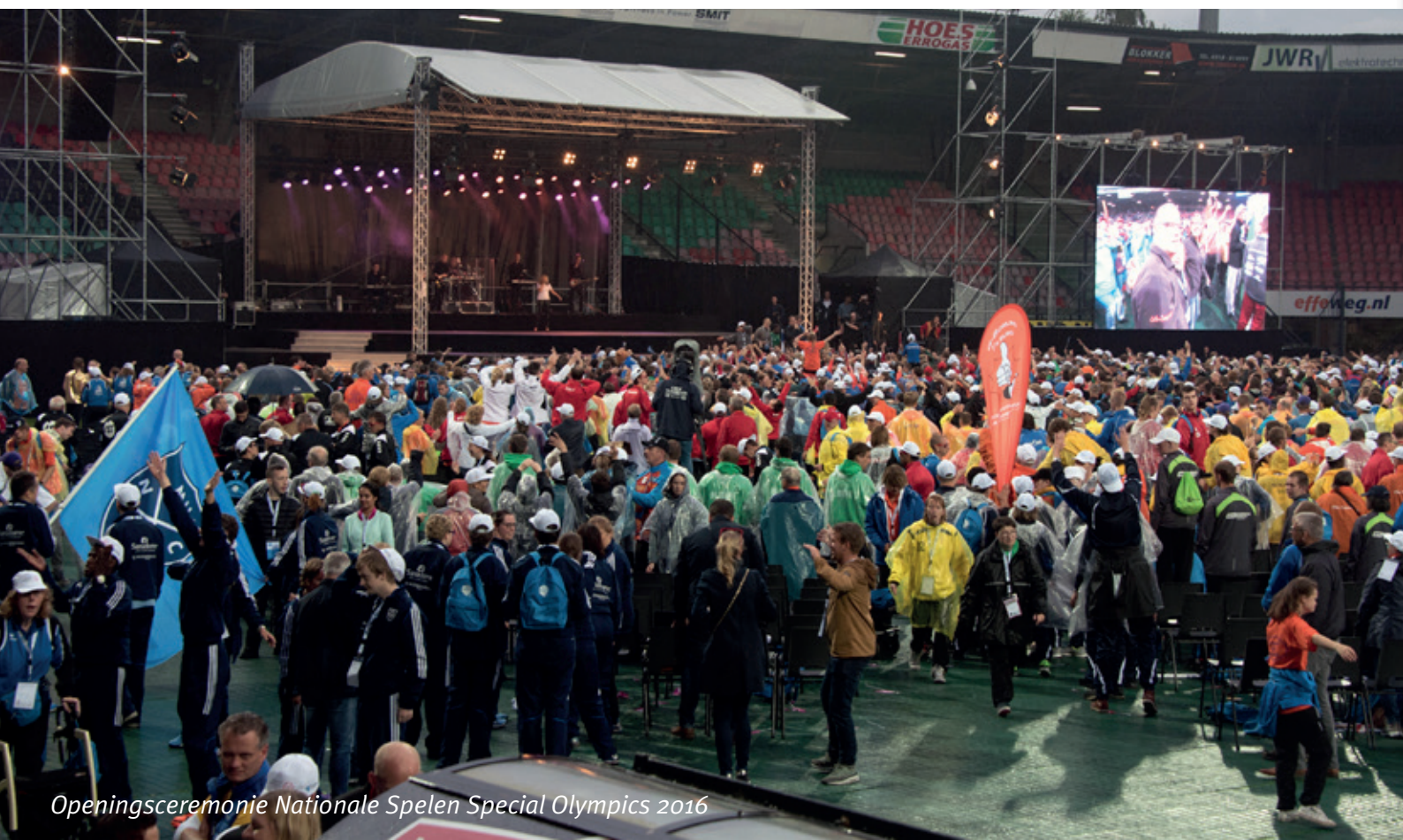
Openingsceremonie Nationale Spelen Special Olympics 2016

In 2016 is het gelukt om een groot aantal fondsen te betrekken bij de projecten en activiteiten van Gehandicaptensport Nederland. Met deze particuliere fondsen werden specifieke projecten zoals Rugby Rookies, jeugdprojecten voor het goalball en boccia, maar ook uitendingen naar internationale toernooien mogelijk gemaakt. Naast particuliere fondsen heeft Gehandicaptensport Nederland voor haar activiteiten ook ondersteuning gekregen vanuit Fonds Gehandicaptensport.