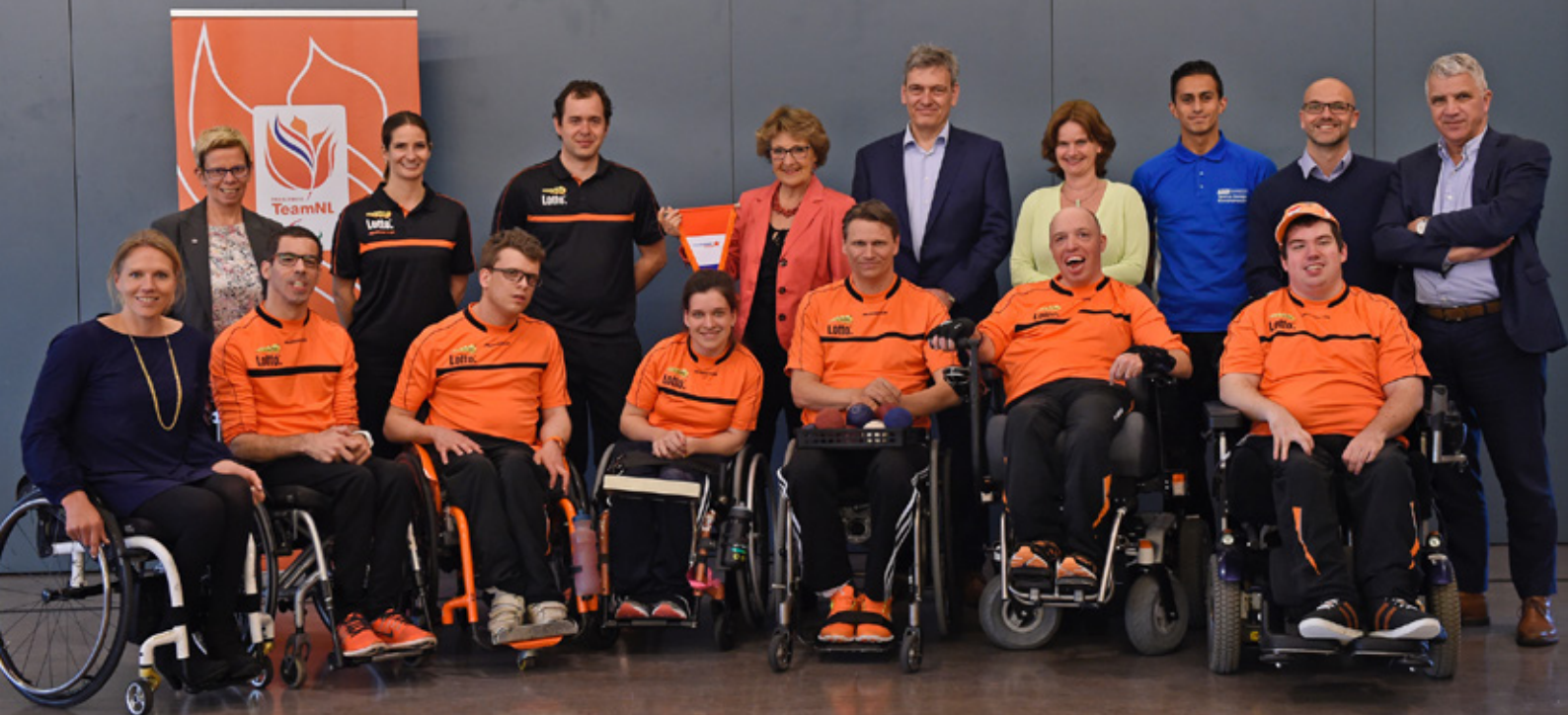
In april bracht Hare Koninklijke Hoogheid Prinses Margriet een bezoek aan het Nationaal Trainingscentrum Boccia in Groesbeek.