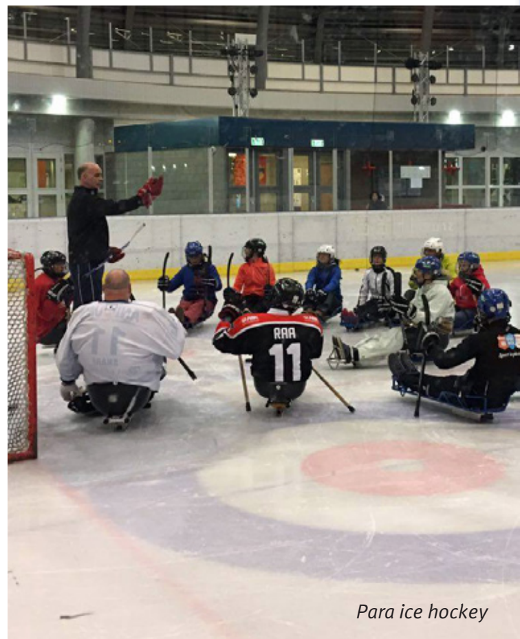
Para ice hockey

De IPC heeft in 2016 besloten de naam van sledgehockey te wijzigen in para ice hockey. Het doel hiervan is om met de naam van de sport een duidelijke koppeling te maken met het reguliere ijshockey. De naam van de community website voor para ice hockey is ook aangepast: www.paraicehockey.nl .