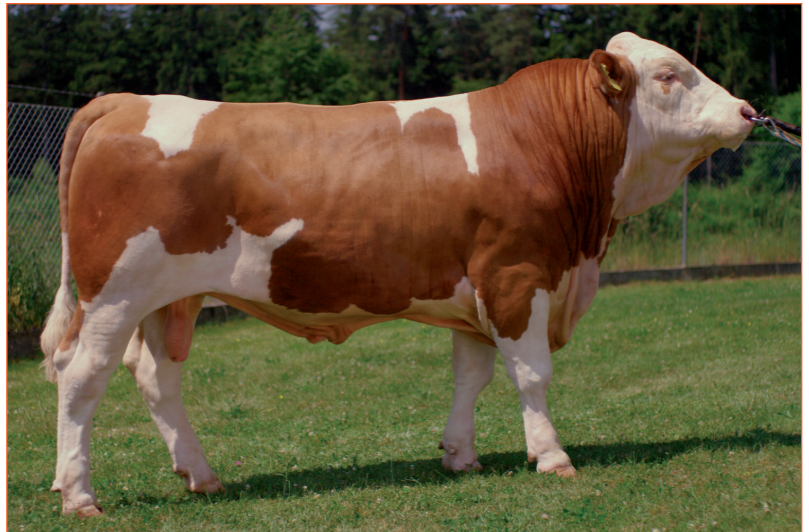
Moeder 5x 11.000kg melk / Grootmoeder 10 x 11.000kg melk. Hoornloze stier